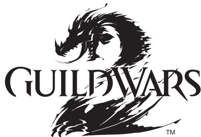
Farbaufschlüsselung für 2-Farben- und 1-Farben-Logos