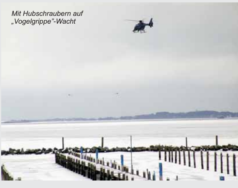
Mit Hubschraubern auf „Vogelgrippe“-Wacht

Weiter heißt es bei SWR: „Die Behörden bereiten sich auf ein mögliches Massensterben von Wildvögeln am Bodensee vor. Seit dem Vormittag ist deshalb ein Hubschrauber im Bodenseeraum auf Kontrollflug unterwegs.“ Na dann sind wir beruhigt.