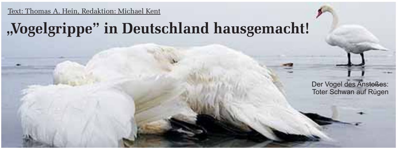
Der Vogel des Anstoßes: Toter Schwan auf Rügen

Das Friedrich-Loeffler-Institut auf der Ostseeinsel Rügen: Hier experimentiert man seit Jahrzehnten mit Tierviren herum, was der Insel zu DDR-Zeiten den Spitznamen „Seucheninsel“ eingebracht hat. Hier befindet sich auch – inmitten eines Vogelschutzgebietes – für die Öffentlichkeit aus gutem Grund unzugänglich (siehe Titelfoto der Depesche) und nur wenige Kilometer von der Insel Rügen entfernt , die größte Virengiftküche Deutschlands sowie ein Produktionsbetrieb für Tierimpfstoffe (Riemser AG, vor der Wende noch Teil des FLI, heute als selbständige AG ausgegliedert)! In diesem Zusammenhang ist interessant, dass die gegenwärtigen, indirekten Testverfahren, die bei der Geflügelpest bzw. „Vogelgrippe“ zur Anwendung kommen, keinen Unterschied zwischen geimpften und tatsächlich bzw. vermeintlich „erkrankten“ Tieren feststellen können. Weiterhin stimmt nachdenklich, dass die Existenz des ominösen H5N1 einschlägigen Meldungen zufolge bisher nur bei bereits toten, nicht aber bei noch lebenden Tieren festgestellt werden konnte! Tritt das Virus etwa erst bei verendeten Tieren in Erscheinung? Ist die ganze Massenpanikmache nichts anderes als ein öffentlichkeitswirksam inszeniertes Affen- bzw. Vogeltheater?