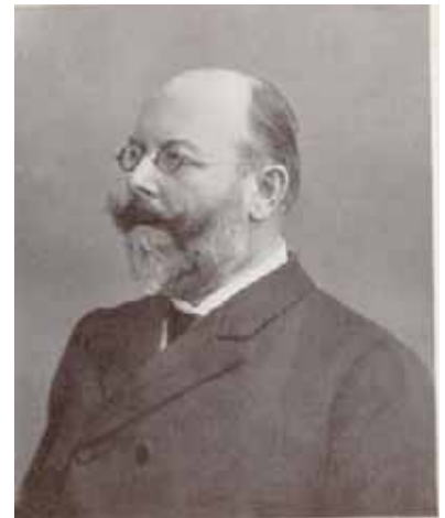
Friedrich Loeffler (1852-1915), Begründer des gleichnamigen Instituts, deutscher Mediziner, Bakteriologe und ehemaliger Schüler Robert Kochs