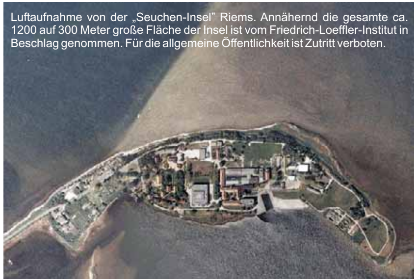
Luftaufnahme von der „Seuchen-Insel“ Riems. Annähernd die gesamte ca. 1200 auf 300 Meter große Fläche der Insel ist vom Friedrich-Loeffler-Institut in Beschlag genommen. Für die allgemeine Öffentlichkeit ist Zutritt verboten.

Am 14.02.2006 gibt das Friedrich Loeffler Institut (FLI), Bundesforschungsinstitut für Tiergesundheit (BFAV), auf der Ostseeinsel Riems in Mecklenburg-Vorpommern folgende Pressemitteilung heraus: „Der Nachweis von hoch pathogenem* H5N1 Geflügelpestvirus in Nigeria und Italien veranlasste das Friedrich Loeffler Institut (FLI) zu einer Neubewertung des Risikos der Einschleppung der Vogelgrippe nach Deutschland. Für über die Südwest- und Zentralroute aus den Brutgebieten [...] ziehende Wildvögel stuft das FLI die Einschätzung von „gering“ auf „mäßig“ hoch. [...] „Offenbar scheinen Schwäne besonders empfindlich zu sein und können als Indikatortiere*