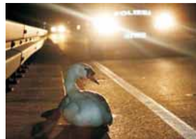
Oh Schreck! Ein Schwan auf der Autobahn bei Donaueschingen rechtfertigt heutzutage also nicht nur einen Polizeieinsatz, sondern scheint eine Nachricht in den Massenmedien wert zu sein: „Vogelgrippe jetzt auch in Süddeutschland?“ fragten gleich mehrere Medien!!

Dies änderte sich erst, als US-Präsident George Bush seinen Landsleuten wiederholt und öffentlich Panik einimpfte, indem er eine drohende Pandemie durch die Vogelgrippe „mit min-