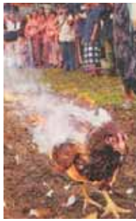
Zu was sind in Angst versetzt Menschen doch alles fähig?!

Die Vogelgrippe und die Pandemiepanikmache werden uns nach dem Willen der Pandemie-Strategen mindestens noch durch das Jahr 2006 begleiten. Bis 1. März wird dazu im Tolzin Verlag die schon angekündigte topaktuelle Video DVD mit Hintergrundinformationen